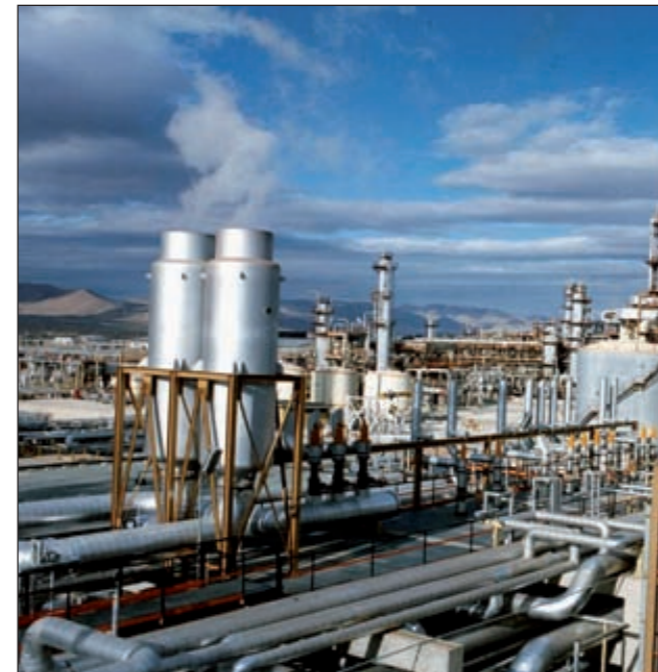
Нефтехимическая отрасль является второй по доходности для Ирана после нефтеторговли. С 2005 года по настоящее время в Иране реализовано 52 нефтехимических проекта общей стоимостью более 22 млрд долларов

Иран намерен также создать новый центр нефтехимической промышленности около Оманского моря в портовом городе Чабахаре с целью содействия экспорту в Индию и Китай. Порт Чабахар расположен на юго-востоке Ирана в провинции Систан и Белуджистан и является ключевым элементом транспортного коридора север-юг. Развивая и расширяя порт в Чабахаре, Иран решает для себя внутреннюю проблему — поднимает экономику провинций