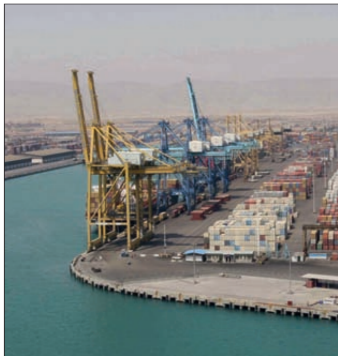
Порт — Бандар-Имам. Иранская нефтехимическая продукция поставляется более чем в 40 стран мира